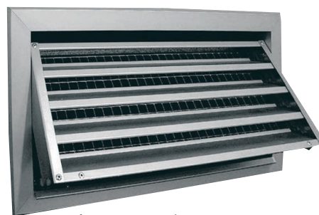
Τύπος BN Επισκέψιμο