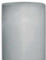
G3 - MK16 (nylon)