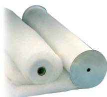
G3 - R 29