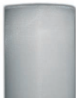
G3 - MK16 (nylon)